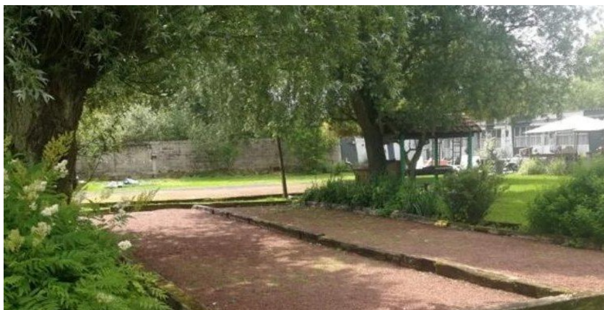
LES TERRAINS DE PETANQUE...