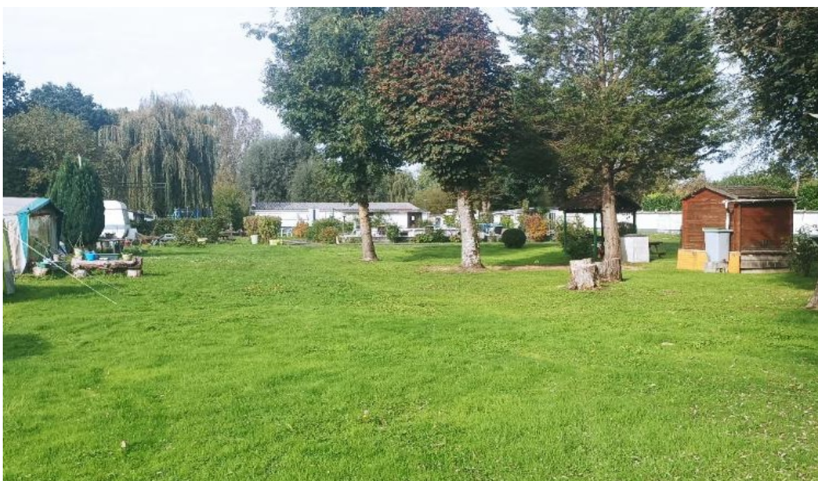
AMBIANCE « NATURE »